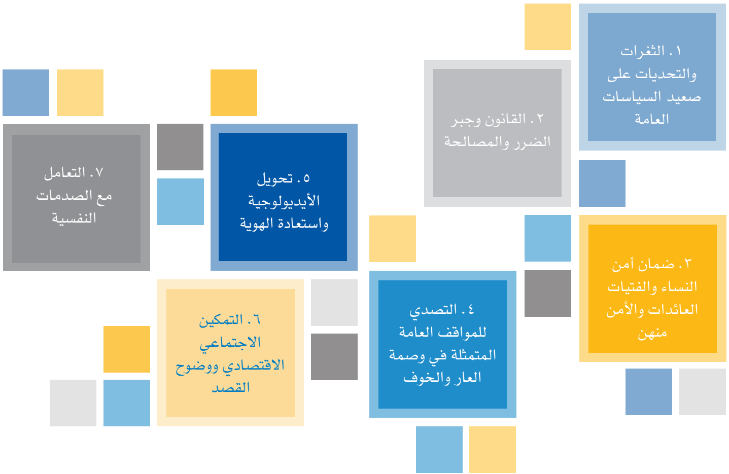
الشكل ٤: العناصر السبعة للنهج المتكامل والجندي لفك الارتباط وإعادة التأهيل وإعادة الإدماج

لقد وجد هذا البحث أن النهج المتكامل متعدد القطاعات ضروري لنجاح برامج فك الارتباط وإعادة التأهيل وإعادة الإدماج للنساء والفتيات المرتبطات بالتطرف العنيف. ويتجلى ذلك في النهج التي تتبعها النساء العاملات في مجال بناء السلام، والموجودات في الخطوط الأمامية للاستجابة إلى الأبعاد المراعية للنوع الاجتماعي فيما يتعلق بالعودة. يتناول كل من أمثلة الممارسات الجيدة الواردة في الجزء الثاني من هذا التقرير العديد من المواضيع الحيوية ومجالات التدخل المحددة والموضحة في الجزء الأول. ويمكن لواضعي السياسات والممارسين التأكد من أن برامج فك الارتباط وإعادة التأهيل وإعادة الإدماج هي برامج متكاملة من خلال ما يلي: