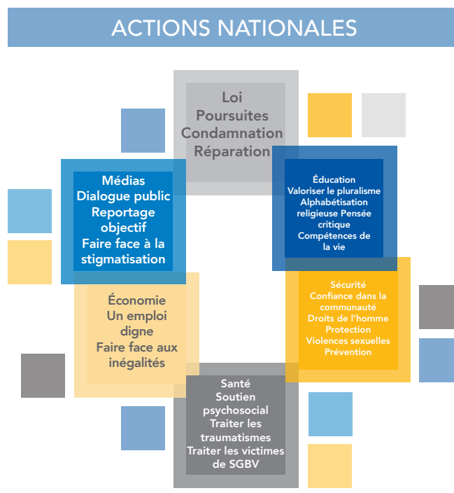
Schéma 3 : Une politique nationale efficace en matière de réhabilitation et de réinsertion devrait être holistique et impliquer tous les secteurs de la société