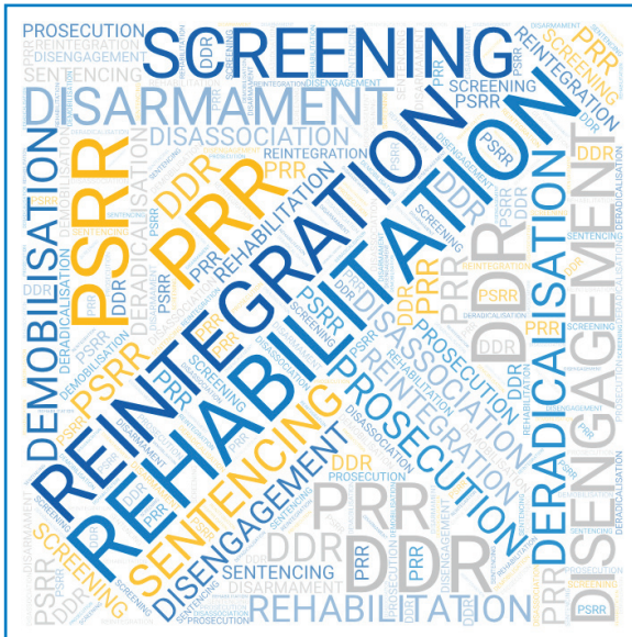
Schéma 1 : La terminologie faisant référence au retour, à la réadaptation et à la réintégration varie considérablement

Le rapport constate que les politiques nationales et internationales relatives au traitement des personnes revenant de groupes extrémistes et terroristes violents transnationaux font toujours défaut. 10 En ce qui concerne le sort des femmes et des enfants, le fossé entre les réalités sur le terrain et les politiques mondiales est encore plus grand. Pendant des années, les femmes et les enfants ont été pratiquement absents de la littérature sur les combattants terroristes étrangers (FTF), car une grande partie de la collecte d'informations et des bourses d'études n'ont pas intégré une analyse axée sur le genre. 11 La question du retour des femmes et des enfants pose des problèmes supplémentaires. Par exemple, déterminer s'ils ont rejoint les groupes volontairement ou s'ils ont été contraints de le faire, et dans quelle mesure ils ont commis des actes de violence ou agi en tant que partisans et facilitateurs.