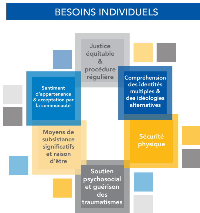
Schéma 2 : Les rapatriés qui ont été associés à des groupes EV ont des besoins multiples et interdépendants

La recherche souligne la nécessité d'une approche globale de la réintégration et de la réhabilitation axée sur le genre, qui tienne compte non seulement des personnes qui rentrent chez elles, mais également de la stigmatisation, des menaces et des vulnérabilités vécues par les membres de la famille et de la communauté associés à l'extrémisme violent. Le rapport apporte une analyse critique des cadres politiques et des processus juridiques existants et présente une cartographie préliminaire des éléments clés d'une approche globale de la réintégration, notamment les composantes : sécurité, sensibilisation du public, idéologique, psychosociale et économique.